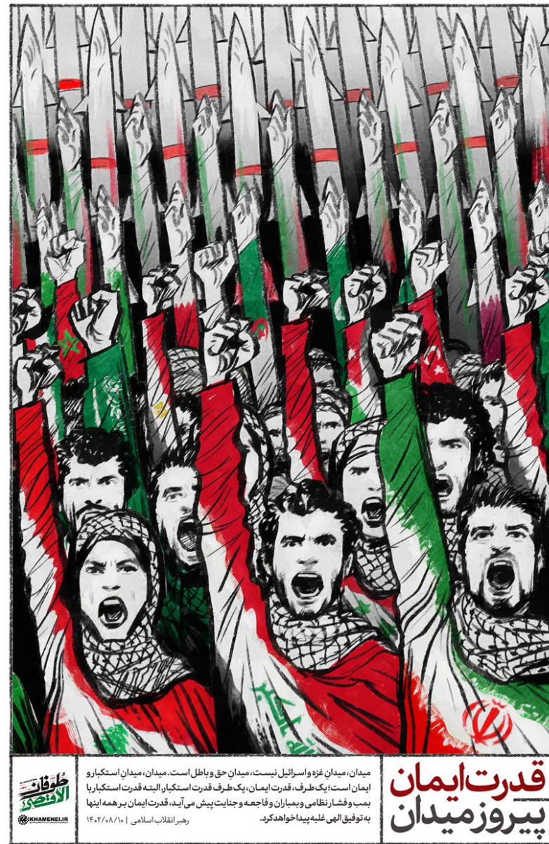
قدرت ایمان پیروز میدان میدان، میدان غرور اسرائیل نیست، میدان حق و باطل است، میدان، میدان استکبار و ایمان است، یک طرف، قدرت ایمان، یک طرف قدرت استکبار، البته قدرت استکبار را بمب و فشار نظامی و بمباران و فاجعه و جنایت پیش می آید، قدرت ایمان بر همه آنها به توفیق الهی غلبه پیدا خواهد کرد. رهبر انقلاب اسلامی ۱۴۰۲/۰۸/۱۰

چم - مدیر کل فرودگاه های استان گفت: کمبود ناوگان هوایی اصلی ترین علت کاهش پروازها است. طهماسبی اظهار کرد: به طور مداوم در حال ریزینی با شرکت های هواپیمایی مختلف در کشور که امکان ارائه خدمات هوایی به استان را دارند، هستیم. وی افزود: برخی از شرکت ها قول تأمین ناوگان داده اند، اما درصد زیادی از شرکت ها پیشنهاد داده اند که استان تسهیلاتی به آن ها برای خرید هواپیما به نام استان بدهد تا به طور کامل در اختیار استان و سفرهای هوایی باشد. مدیر کل فرودگاه ها با بیان اینکه اطلاع از اینکه استان توانایی پرداخت این تسهیلات را دارد یا خیر نداریم، اما کمترین در حال ریزینی با شرکت های هواپیمایی که ناوگان دارند هستیم تا بتوانیم پروازهای ثابتی برای استان از آن ها بگیریم. وی ادامه داد: چه از لحاظ زیرساختی و چه از لحاظ خدمات دیگر در استان هیچ مشکلی نداریم و هر شرکت هواپیمایی که درخواست کند می تواند با آن ها همکاری کنیم. مدیر کل فرودگاه ها بیان کرد: بسیاری از ایرلاین ها به علت کمبود ناوگان هوایی از همکاری با استان عاجزند. وی بیان کرد: به نظر می رسد برای حل این مسئله باید سرمایه گذاران بخش خصوصی در استان ورود پیدا کرده و سرمایه گذاری کنند.