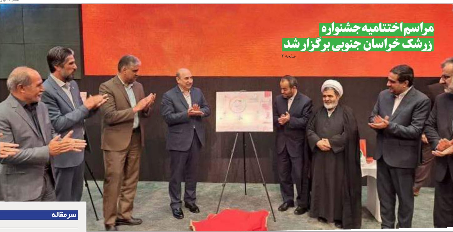
مراسم اختتامیه جشنواره زرشک خراسان جنوبی برگزار شد