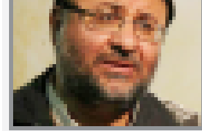
توربین سلفه‌های از انتشار این تصویر تصویر محافظان از دست‌برداری می‌کنند.

در حالی که مسابقات بدنسازی در ایران به شکل فزاینده‌ای در حال گسترش است، اما نوعی برهنگی در این مسابقات دیده می‌شود. در این مسابقات، بدنسازان با لباس‌های بسیار کم‌پوشاک شرکت می‌کنند که باعث می‌شود بدن آن‌ها کاملاً نمایان شود. این نوع مسابقات در بین جوانان بسیار محبوب است و باعث شده است که بسیاری از آن‌ها به این ورزش علاقه پیدا کنند.