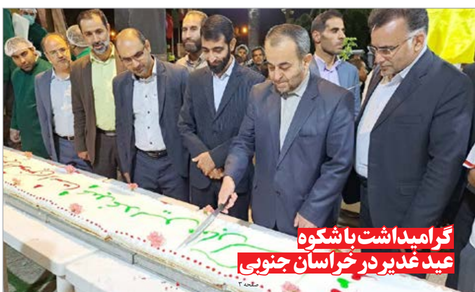
گرامیداشت با شکوه عید غدیر در خراسان جنوبی