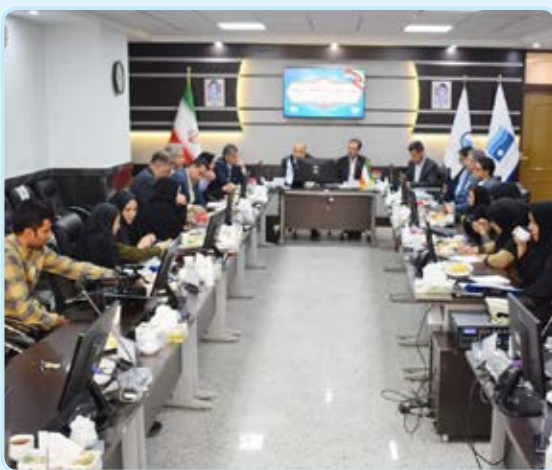
خراسان جنوبی نصف متوسط کشوری است.

عضو هیئت مدیره شرکت آب منطقه‌ای خراسان جنوبی هم در ادامه با بیان اینکه در کل کشور به خصوص در نواحی شرقی با کمبود شدید منابع آبی مواجه هستیم، متوسط بارندگی در کشور را یک سوم متوسط جهانی اعلام کرد که این نرم در