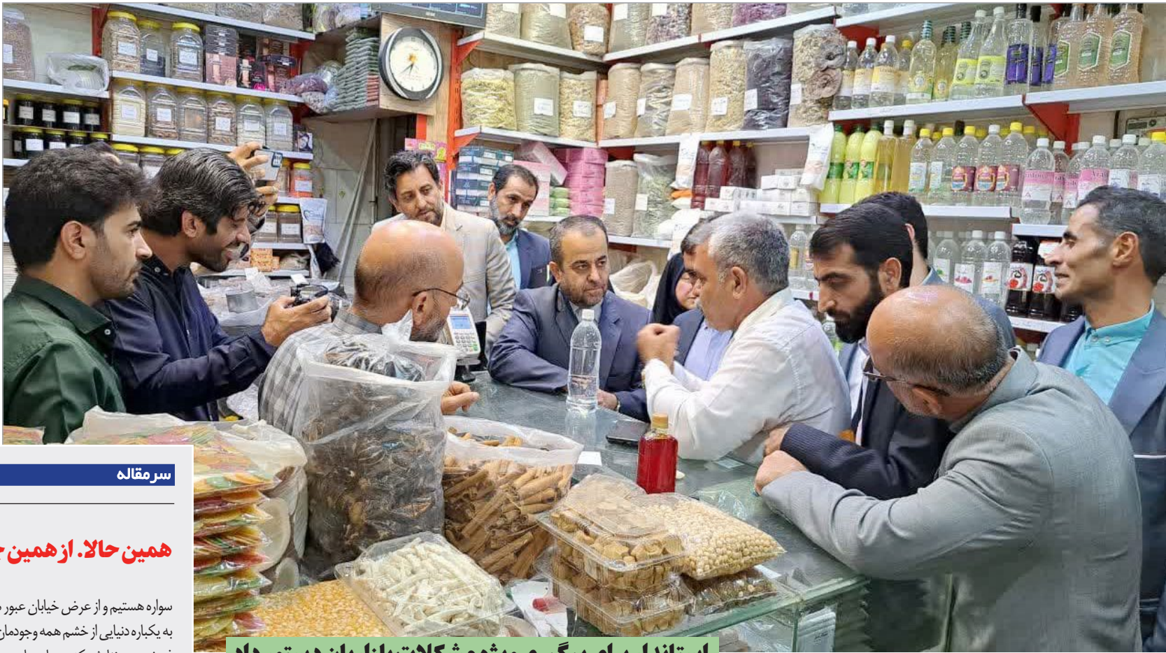
استاندار برای پیگیری ویژه مشکلات بازاریان دستور داد

شهادت پنجمین ستاره عالم تاب امامت، امام محمد باقر (علیه السلام) تسلیت باد