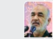
سلامی، فرمانده کل سیاه:

اتصال ۸۰ در صد روستاهای استان به شبکه ملی اطلاعات ۵ | توزیع ۱۱ تانکر آب در قالب نذر آب ۵ در استان ۲ | تصادفات در صدر پرونده‌های پزشکی قانونی خراسان جنوبی ۵