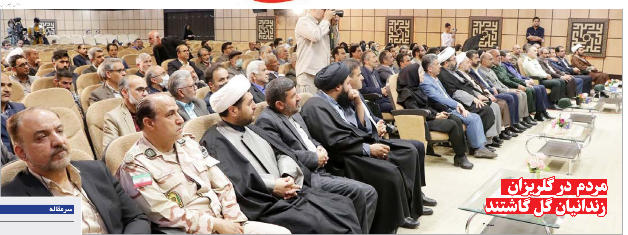
مردم در گلریزان زندانیان گل گاشتند

روزنامه صبح استان * سال بیست و ششم * شماره ۵۴۵۱