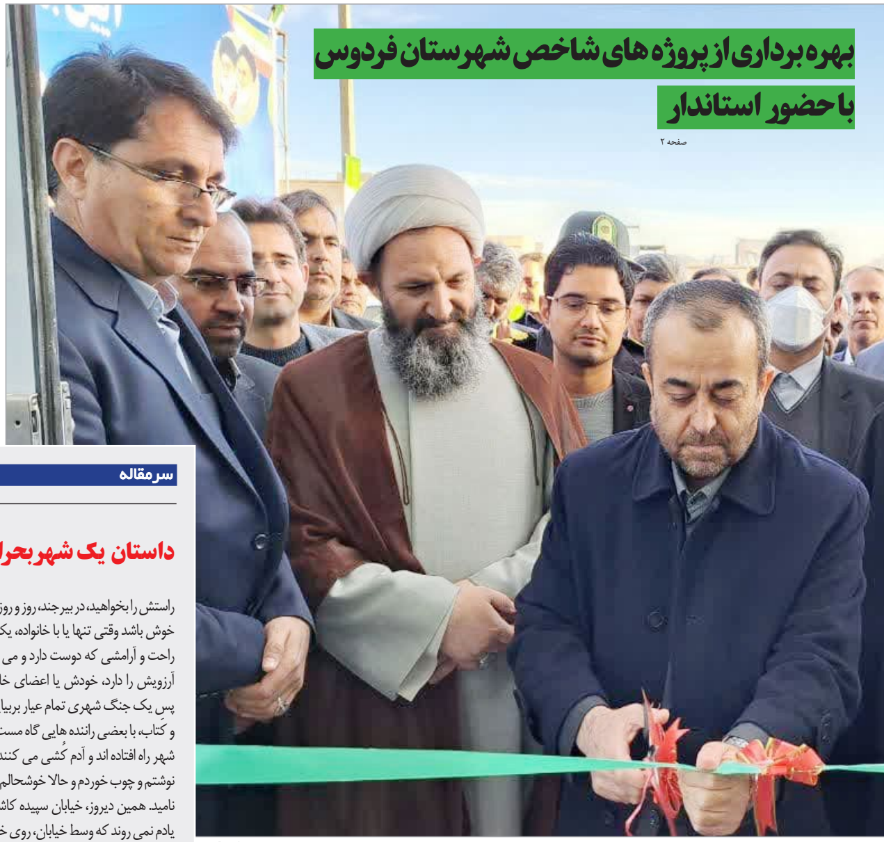
بهره برداری از پروژه های شاخص شهرستان فردوس با حضور استاندار

رحلت جانگداز پیام آور کربلا حضرت زینب (سلام... علیها) تسلیت باد