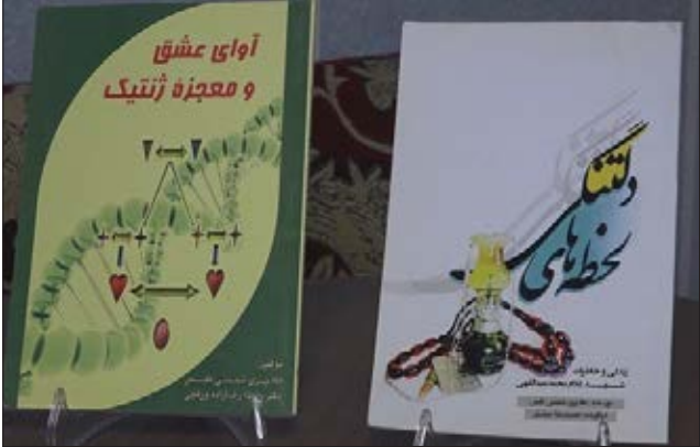
خانم شمسى بانوى نایبى شھر طیس