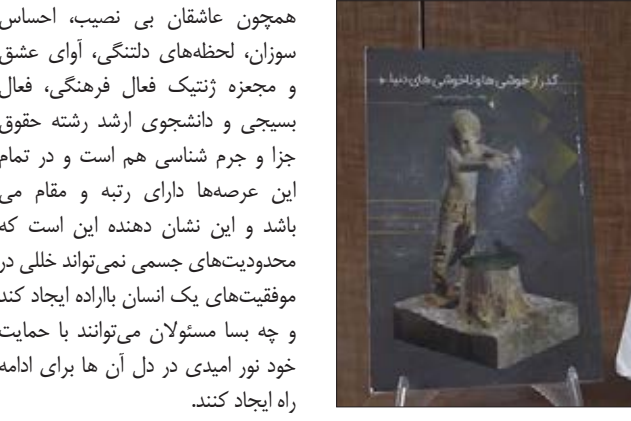
خانم شمسى بانوى نایبى شھر طیس