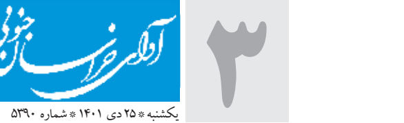
یکشنبه ۲۵ دی ۱۴۰۱ شماره ۵۳۰

اجرای برنامه‌های هفته فرهنگی استان که قرار بود از روز ۲۴ دی ماه در ۱۱ شهرستان خراسان جنوبی برگزار شود، به هفته آینده مصادف با اوایل بهمن ماه موکول شد.گفتنی است از حدود دو ماه پیش با برگزاری جلسات هماهنگی بین دستگاه‌های اجرایی استان، قرار بود به مناسبت هفته فرهنگی استان از ۲۴ تا ۳۰ دی ماه در ۱۱ شهرستان استان برنامه‌های هفته فرهنگی برگزار شود.