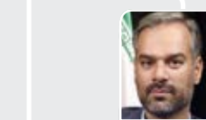
کوچی، نماینده مجلس:

در بیانیه مجلس نیامده که معترضان را اعدام کنید