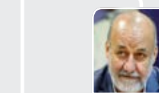
بیادای، فعال اصولگرا:

مردم از دعوای زرگری دو جناح عبور کرده‌اند