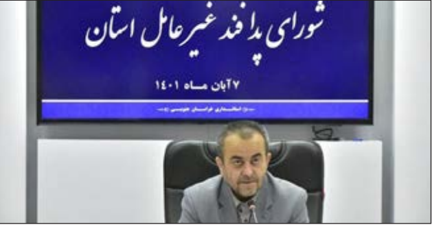
استاندار خراسان جنوبی

در رفع تهدیدات دشمن نقش آفرین باشد و با توجه به احتمال بروز تهدیدات مختلف، تکلیف دستگاه‌هاست که در همه طرح‌ها