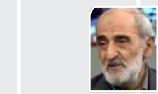
مدیرمسئول روزنامه کیهان:

پنجشنبه ۱۴۰۱ آبان ۱۴ * ربيع الثاني ۱۴۴۴ * ۱۲۷ اکتبر ۲۰۲۲