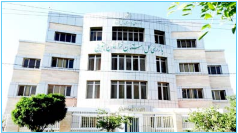
ملی در سه ماه گذشته گفت: اصلاح مبلغ آب بها و آپرسانی به عشا، افزایش اعتبارات ایل راه ها و رفع مشکل و موانع تولید ۲۰ واحد تولیدی در یک سال اخیر از دیگر اقدامات سازمان بازرسی در خراسان جنوبی بوده است. بازرس کل خراسان جنوبی افزود: ارایه پیشنهاد تشکیل ناحیه علم و فناوری به شورای شهر، پیگیری اعمال امتیاز سهمیه بومی استخدامی آموزش و پرورش، مکلف کردن پزشکان به انعقاد قرارداد با بیمه های پایه، جلوگیری از واگذاری ۱۰ هکتار اراضی الحاقی به شهرک فرهیختگان از دیگر اقدامات بازرسی کل استان است. وی چگونگی تمدید پروانه های چاه کشاورزی، آزادسازی پنج هزار فقره

گذشته با اختلاف بسیار اندک برابر است، گفت: در ۶ ماه ابتدای امسال ۳۱ گزارش برنامه ای و ۲۷ گزارش موردی و یک فقره بازرسی فوق العاده داشته ایم. وی ادامه داد: در همین مدت ۶ مورد گزارش کیفری بازرسی استان انجام داده که ۲۰ متهم در آن نقش داشته اند و تعداد تخلفات اداری نیز ۱۱ مورد بوده که ۱۸ متهم در رده های مدیران کل، معاونان، کارشناسان یا مستخدمین عادی ذیل هستند. رحیمی اظهار کرد: علاوه بر این موارد در مجموعه بازرسی کل استان واحد