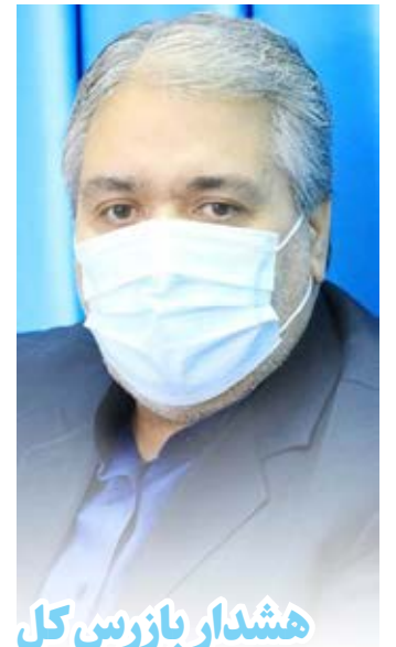
هشدار بازرس کل به شهردار بیرجند؛ فرهنگسرا نایمن است

بازرس کل استان خراسان جنوبی گفت: گزارش هایی مبنی بر عدم توجه شهرداری به استانداردهای بهداشتی و ایمنی در فرهنگسرای بیرجند دارد و هشدارهایی در این خصوص به شهردار داده ایم، لذا باید این محل تعطیل و از برگزاری هرگونه جلسه ای تا زمان رفع ایرادات و پایدار سازی ایمنی خودداری شود. مهدی رحیمی روز گذشته در نشست خبری به مناسبت سالروز تشکیل سازمان بازرسی کل کشور اظهار کرد: ... مشروح در صفحه ۶