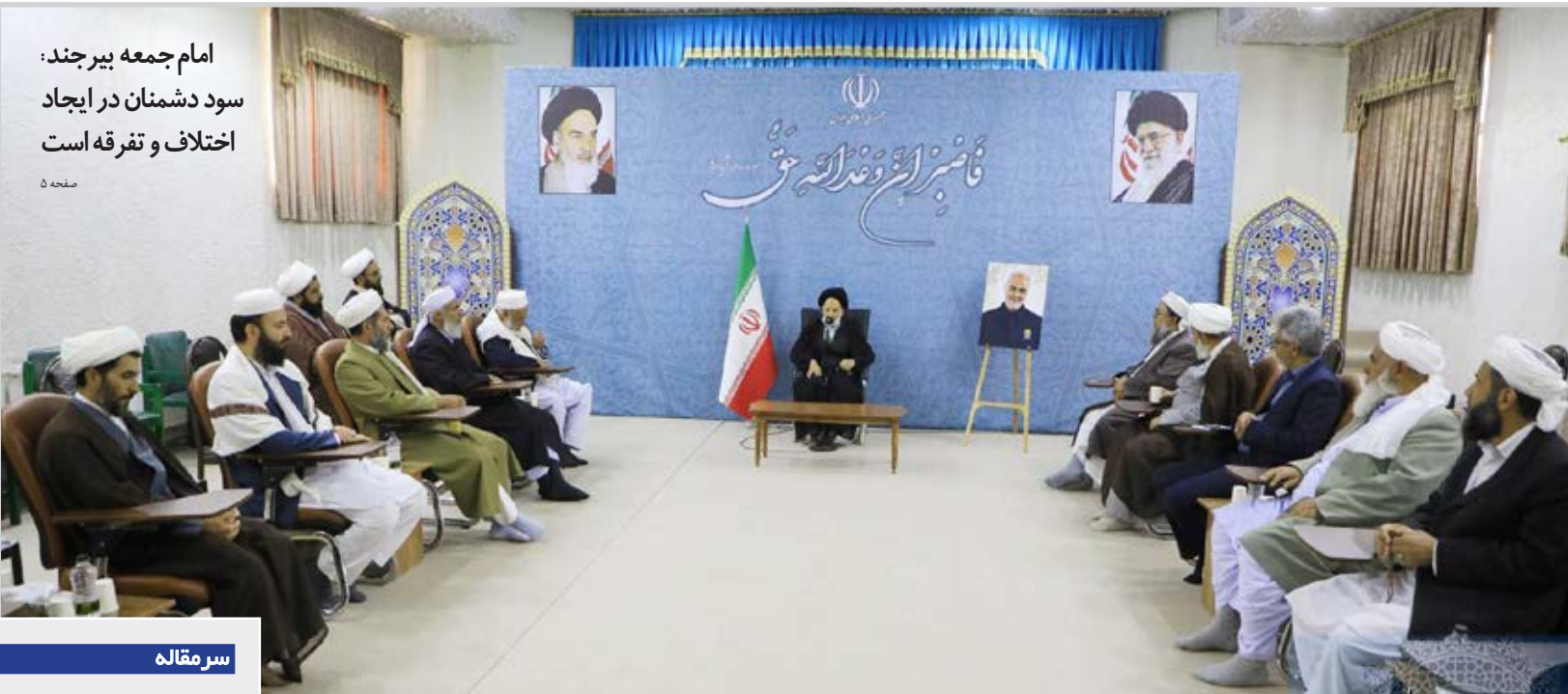
امام جمعه بیرجند: سود دشمنان در ایجاد اختلاف و تفرقه است