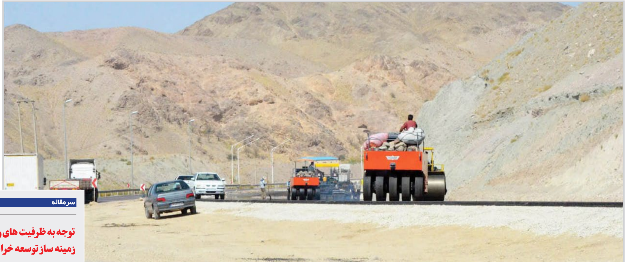
خبر خوش استاندار از اختصاص بودجه ویژه برای راه های خراسان جنوبی در دیدار با وزیر راه و شهرسازی؛