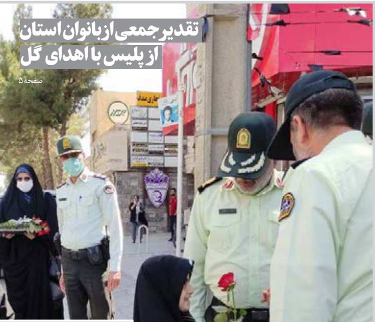
تقدیر جمعی از بانوان استان از پلیس با اهدای گل