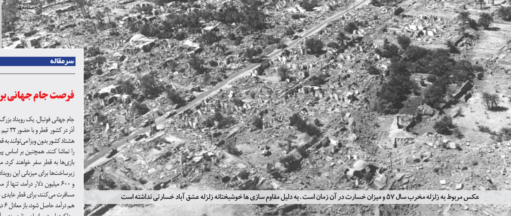
عکس مربوط به زلزله مخرب سال ۵۷ و میزان خسارت در آن زمان است. به دلیل مقاوم سازی ها خوشبختانه زلزله عشق آباد خسارتی نداشته است

۲ هزار میلیارد تومان به توسعه راه های خراسان جنوبی اختصاص یافت