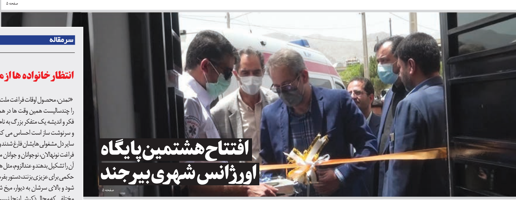
افتتاح هشتمین پایگاه اورژانس شهری بیرجند

طرح خرده فروشی در مرزها به زودی آغاز می شود