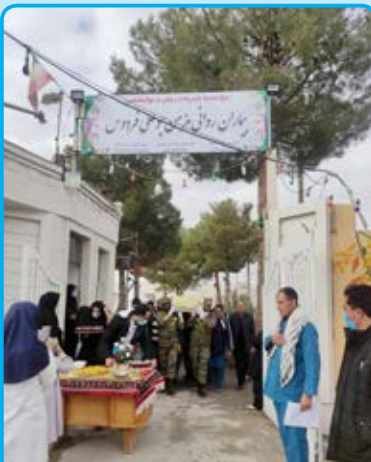
شهید گمنام در حلقه محبت پدران غریب

(۰۳۷۹۹۱۸۹۶۶۹۴۳۲) (۰۳۷۹۹۱۸۹۶۶۹۴۳۲) (۰۳۷۹۹۱۸۹۶۶۹۴۳۲) (۰۳۷۹۹۱۸۹۶۶۹۴۳۲) (۰۳۷۹۹۱۸۹۶۶۹۴۳۲) (۰۳۷۹۹۱۸۹۶۶۹۴۳۲) (۰۳۷۹۹۱۸۹۶۶۹۴۳۲) (۰۳۷۹۹۱۸۹۶۶۹۴۳۲) (۰۳۷۹۹۱۸۹۶۶۹۴۳۲) (۰۳۷۹۹۱۸۹۶۶۹۴۳۲)