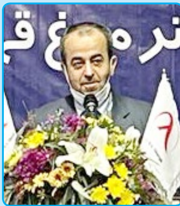
دغدغه سرمایه گذار باید رفع شود

خوراک دام و مزرعه کشت علوفه و دامداری های صنعتی زیر مجموعه این شرکت است که مجوزهای مربوط به آن اخذ گردیده و به یاری خداوند متعال عملیات اجرایی واحد های فوق الذکر در سال آینده آغاز و با راه اندازی آن بالغ بر ۱۰۰۰ نفر به به طور مستقیم مشغول به کار خواهند شد.