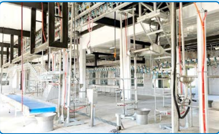
کشتارگای جنوبی اظهر کرد: سرمایه گذاری در تکمیل زنجیره تولید محصولات برتر و مزیت دار غذایی نیز در دستور کار است.