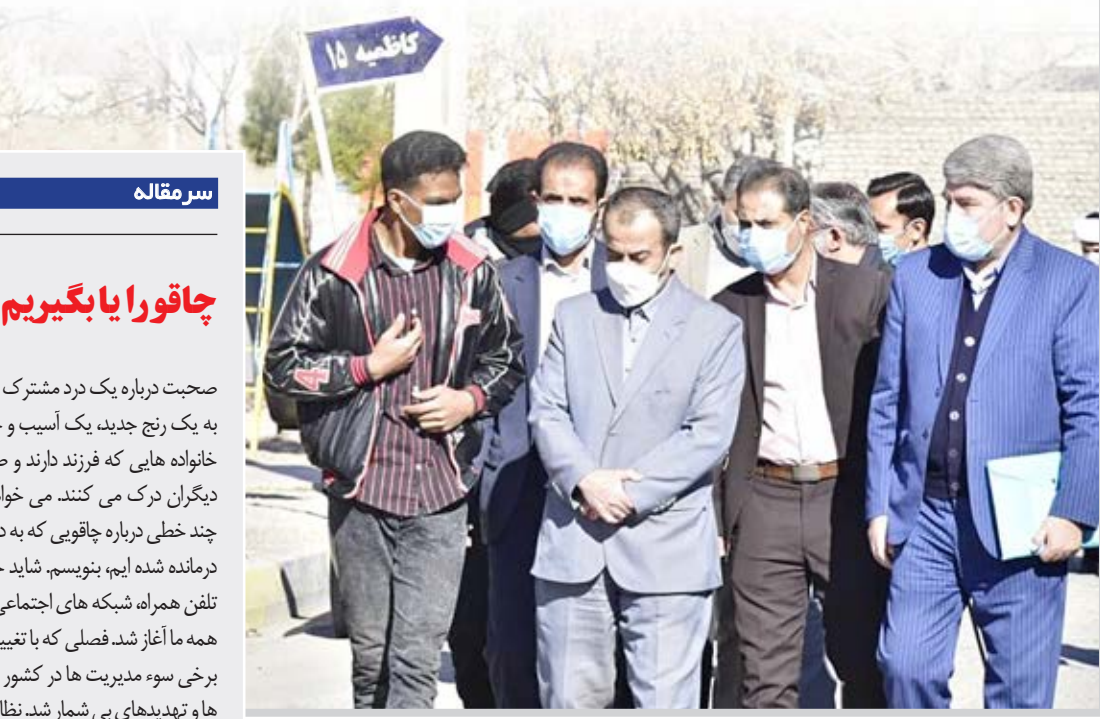
قائم‌مقصد دومین سفر استاندار: شتاب بخشیدن به پروژه‌ها هدف اصلی سفرهای استانی