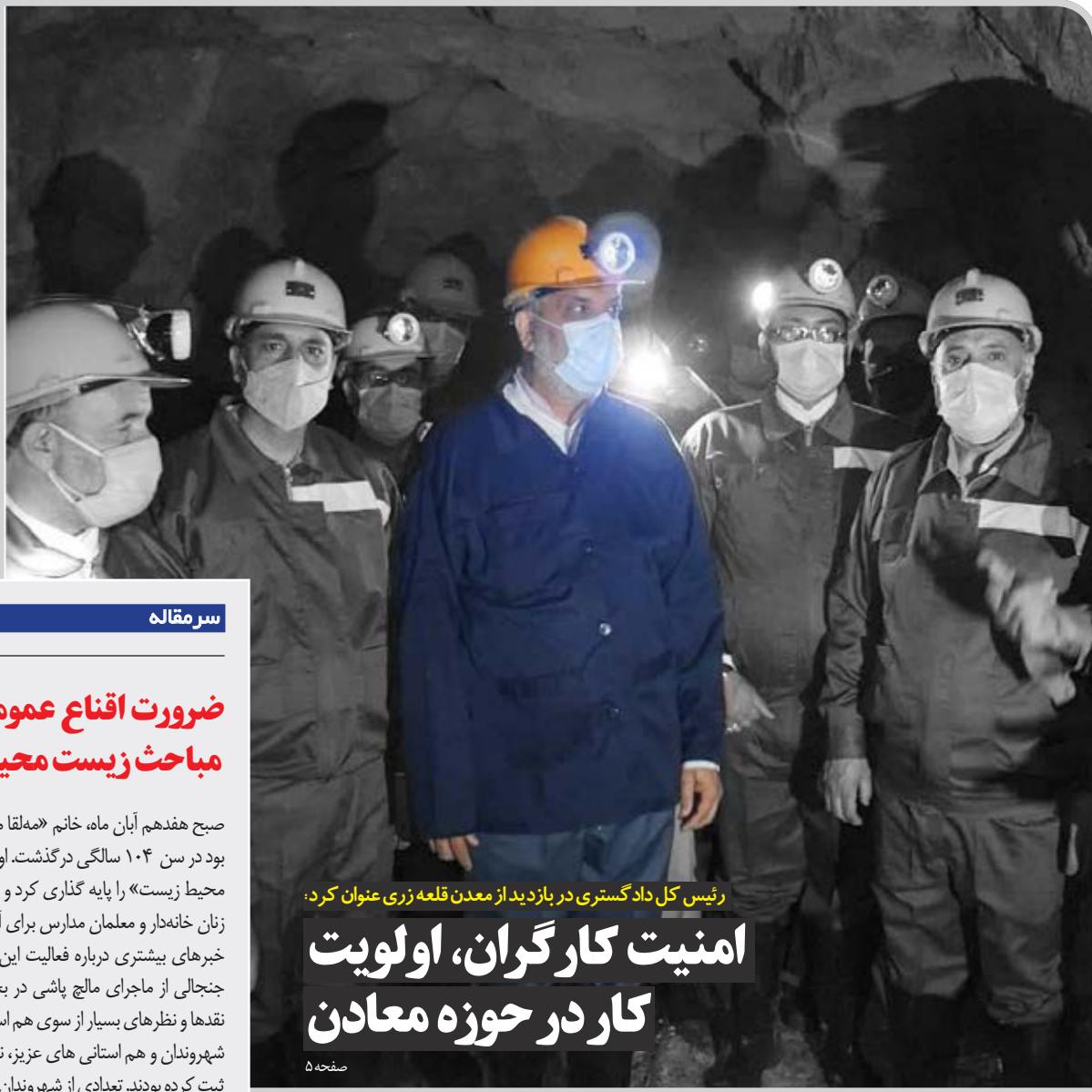
رئیس کل دادگستری در بازدید از معدن قلعه زری عنوان کرد.

چهارشنبه ۱۹ آبان ۱۴۰۰ * ۴ ربیع الثانی ۱۴۴۳ * ۱۰ نوامبر ۲۰۲۱