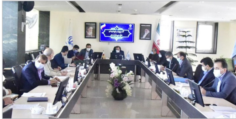
دبیری مدیرکل راه و شهرسازی خراسان جنوبی و با حضور تمامی اعضا در محل

رسید. هفتمین جلسه کارگروه زیربنایی، توسعه روستایی، عشایری، شهری و آمایش سرزمین و محیط زیست استان به شورای اسلامی گفت: ساخت بیمارستان