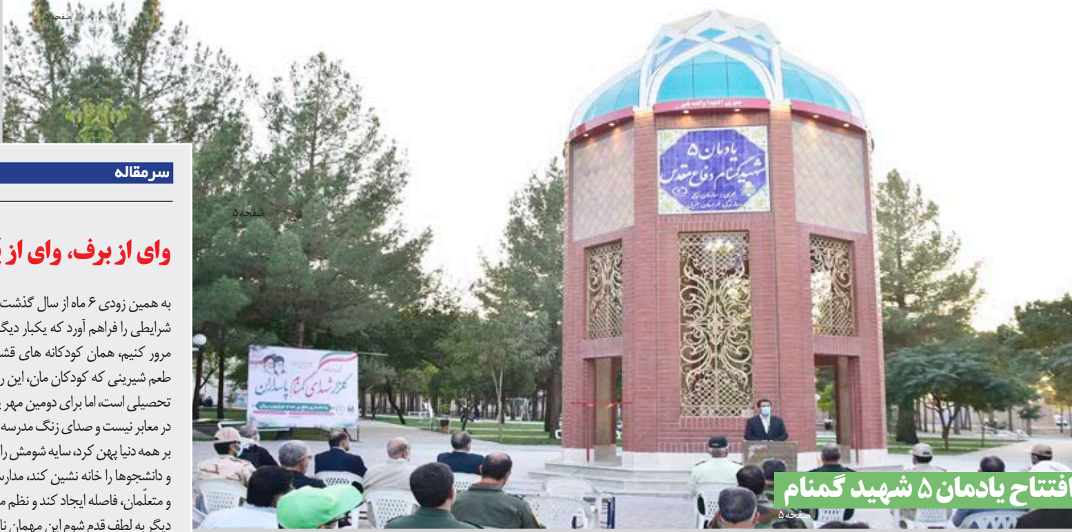
افتتاح یادمان ۵ شهید گمنام