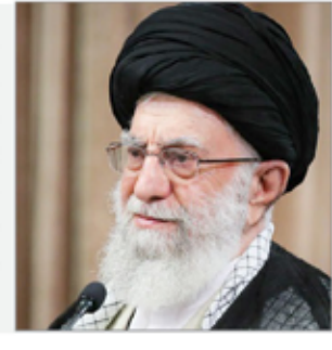
امکان ساخت چهار میلیون مسکن وجود دارد

مجلس مذاکره را قبول دارد که از موضع عزت انجام شود نماینده مردم تهران در مجلس گفته: مجلس مذاکره را قبول دارد و تأیید می‌کند که از موضع عزت انجام گیرد و نباید اقتصادمان در گرو این موضوع بماند. میرسلیم افروزد، مجلس از تعامل جمهوری اسلامی در سطح بین‌المللی برای دفاع از حقوق مردم ایران استقبال می‌کند. ولی اعتقاد ندارد که باید فعالیت‌های مختلف کشور در گرو مذاکرات بماند.