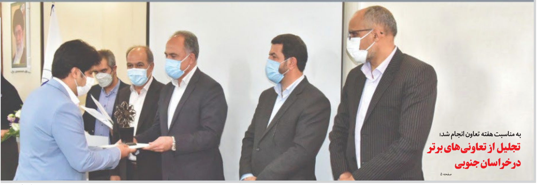
به مناسبت هفته تعاون انجام شد؛ تجلیل از تعاونی های برتر در خراسان جنوبی