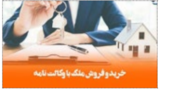
خرید و فروش ملک با وکالت نامه

گاهی به دلایلی مانند زمان بر بودن نقل و انتقال ملکه، هزینه بر بودن نقل و انتقال، در دسترس