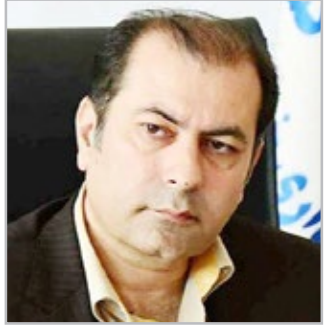
فارس - معاون هماهنگی امور عمرانی استاندار خراسان جنوبی گفت: از ابتدای سال جاری تا نهم مرداد ماه تعداد روزهای با کیفیت هوای نامطلوب