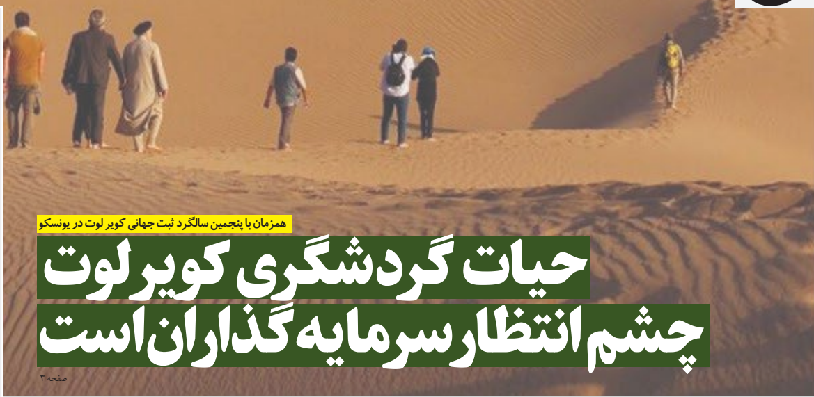
همزمان با پنجمین سالگرد نیت جهانی کویر لوت در یونسکو

معاون عمرانی استاندار: تنها ۳۲ کیلومتر از جاده بیرجند - قاین دو پانده نشده که تلاش ما بر این است ۱۵-۱۴ کیلومتر تا پایان شهریور امسال و مابقی تا پایان سال و یا حداکثر سال آینده به اتمام خواهد رسید * مدیرکل راه و شهرسازی ، عملیات دوبانده سازی محور بیرجند - قاین از سال ۸۹ آغاز شد و ۴۵ کیلومتر تا پایان سال ۹۸ دوبانده شد که متوسط سالی ۵.۴ کیلومتر است * سال ۹۹ با پیگیری های بسیار زیاد مجموعه استان به تنهایی ۲۵ کیلومتر از این جاده دوبانده شد که پنج برابر متوسط عملکرد دوبانده سازی در ۱۰ سال گذشته بوده است * در حال حاضر حدود ۷۰ کیلومتر از این مسیر دوبانده است و ۳۰ کیلومتر باقی مانده که ۱۴ کیلومتر آن حداکثر تا ۱.۵ ماه آینده به بهره برداری می رسد و اسفالت انجام شده است، ۱۶ کیلومتر باقی مانده نیز عمدتاً ماشین آلات مستقر است و ۴۵ درصد پیشرفت فیزیکی دارد ... مشروح در صفحه ۲