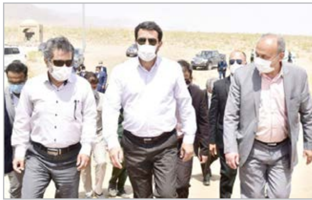
همین کویر همت آباد با تپه‌های ماسه‌ای می‌تواند لحظات خوبی را برای گردشگران

به همراه داشته باشد. ملائوری تأکید کرد: با توجه به اهمیت گردشگری و نقشی که می‌تواند در توسعه استان داشته باشد، برنامه‌ریزی برای تأمین امکانات مورد نیاز جهت ایجاد پایگاه گردشگری در همت آباد انجام خواهد شد. وی متذکر شد جذب سرمایه‌گذار بخش خصوصی برای حضور و فعالیت در این حوزه نیز به طور جدی دنبال می‌شود. علاوه بر این استاندار خراسان جنوبی در جمع مردم گنجم و مهمانشهر از تویح شهرستان زیر کوه حضور یافت و با اهالی و معتمدین این روستا دیدار کرد و از نزدیک در جریان مسائل و مشکلات آنها قرار گرفت. وی با اشاره به دو ظرفیت