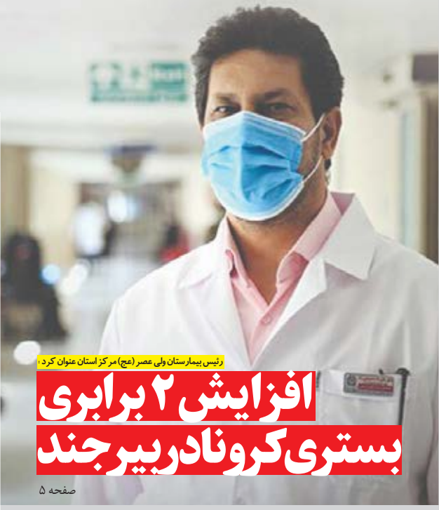
تیس بیمارستان طی عصر (مرکز استان عنوان کرد)