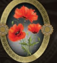
مرحومه کربلاییه نرجس عارفی نژاد (همسر آقای حسن نژاد)