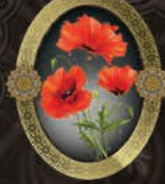
مرحومه زهرا الماسی (همسر آقای مهدی زمردی)