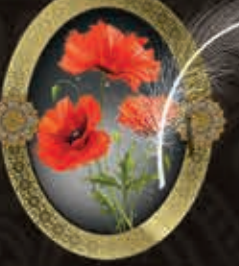
مرحومه خدیجه زیرچی (همسر مرحوم رمضان ملای)