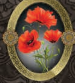
مرحومه معصومه حاجی پور (همسر آقای مهدی ایرانی)