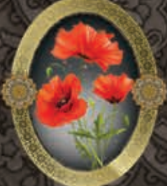
مرحومه حاجیه خدیجه فخری (مادر شهیدین گرانقدر طیبی نژاد)