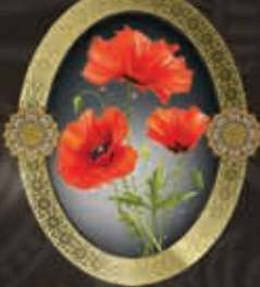
مرحومه مهری هاتف (همسر مرحوم ناصر)