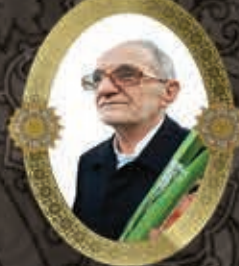
حاج محمدرضا ریاسی