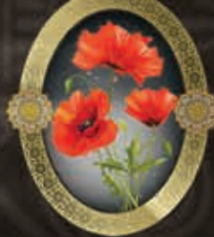
مرحومه کربلاییه فاطمه محمدی