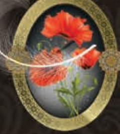
مرحومه زهرا حقیجو (همسر مرحوم برات ملانی)