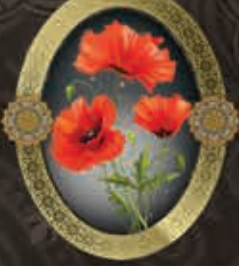
مرحومه حاجیه مرضیه دلیلی (همسر مرحوم کربلایی علیرضا فروز)