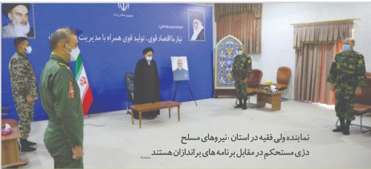
نماینده ولی فقیه در استان و نیروهای مسلح دژی مستحکم در مقابل برنامہ های براندازان هستند

یکشنبه ۲۹ فروردین ۱۴۰۰ * ۵ رمضان ۱۴۴۲ * ۱۸ آوریل ۲۰۲۱