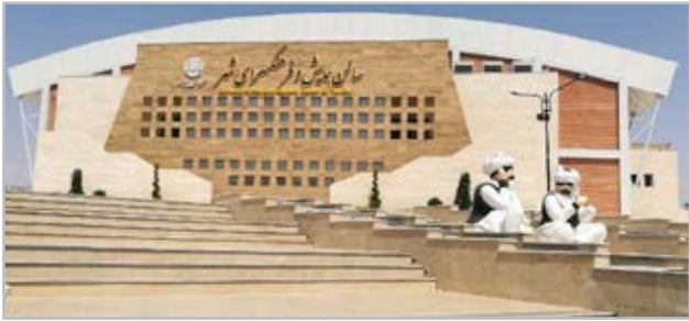
برگزار شد. همچنین معاون توسعه روستایی و مناطق محروم ریاست جمهوری، وزیر کشور، معاون عمران و توسعه امور شهری

فرهنگسرای بیرجند با حضور معاون اول رئیس جمهوری افتتاح شد. سالن همایش و فرهنگسرای شهر بیرجند به عنوان بزرگترین فرهنگسرای شرق کشور روز گذشته به صورت ویدئو کنفرانس با حضور «ساحق جهانگیری» معاون اول رئیس جمهوری افتتاح شد. این طرح عمران شهری در آستانه نهم اردیبهشت روز شورای از طریق ارتباط تصویری با معاون اول رئیس جمهوری، استاندار خراسان جنوبی، فرمانده انتظامی استان، فرماندار بیرجند و برخی از مسئولان استانی در بیرجند