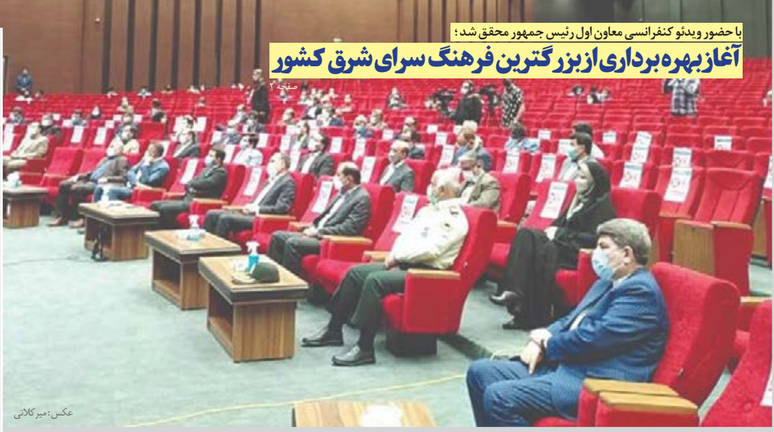
با حضور ویدئو کنفرانسی معاون اول رئیس جمهور محقق شد: آغاز بهره برداری از بزرگترین فرهنگ سرای شرق کشور

معاون دادگستری خراسان جنوبی با اشاره به اینکه فضای انتخاباتی خراسان جنوبی از طریق اعضای ستاد پیشگیری از وقوع جرم دادگستری هشدار داد؛ که هنوز اسامی تأیید صلاحیت شده‌ها اعلام نشده برخی از افراد اقدام به تبلیغات در فضای مجازی می‌کنند که این مهم توسط پلیس فتای استان پیگیری می‌شود. مشروح در صفحه ۵