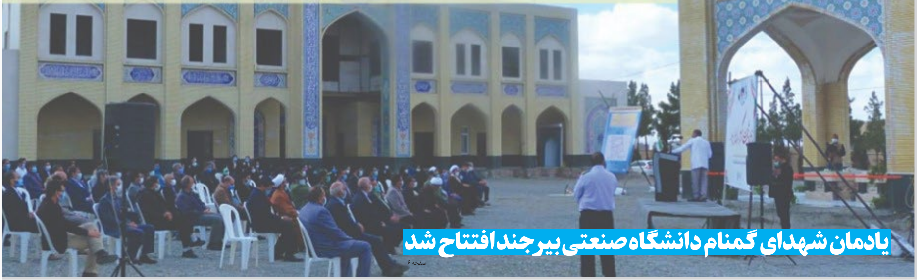
یادمان شهدای گمنام دانشگاه صنعتی بیرجند افتتاح شد

مراقب سودجویی دلالان فیش حج و عمره باشید ۳ | اعطای تقدیرنامه سه ستاره جایزه ملی تعالی سازمانی به کویر تایر ۲ | زنگ اشتغالزایی با رنگ مس ۵