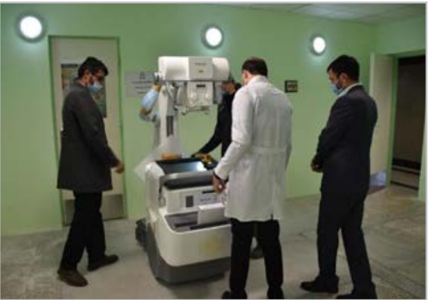
بایگ گیری های مکرر صورت گرفته توسط اداره

رادیوگرافی در بازار ۱۷ میلیارد ریال است که