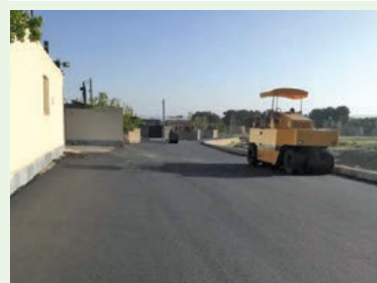
زیرسازی و آسفالت معابر