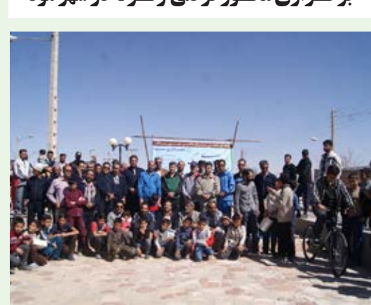
برگزاری همایش پیاده روی خانوادگی