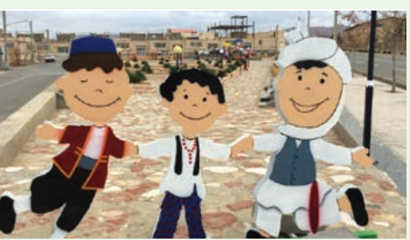
طراحی و ساخت المان های نوروزی