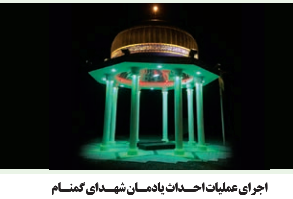
اجرای عملیات احداث یادمان شهدای گمنام