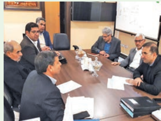
دیدار شهردار و اعضای شورای اسلامی شهر با مسئولان کشوری