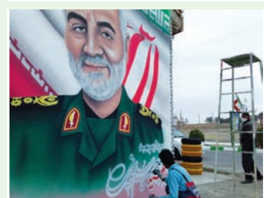
ترسیم تمثال مبارک سردار شهید سپهبد حاج قاسم سلیمانی