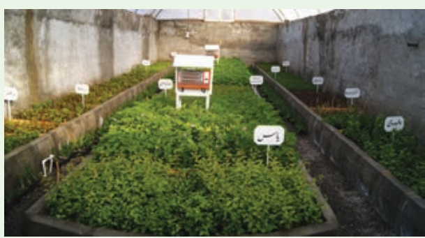
احداث و بهره برداری از ۳ باب ساسی گلخانه ای