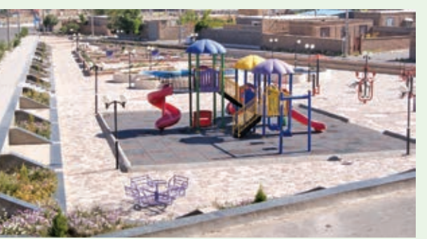
خرید سه مجموعه بازی پلی اتیلن با کف پوش استاندارد و نصب در بوستان ها