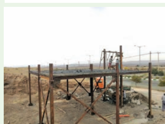
احداث مسجد بركت