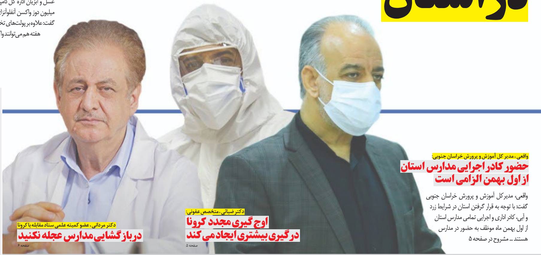
واقعی، مدیر کل آموزش و پرورش خراسان جنوبی: