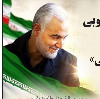
بسم رب الشهداء والصدیقین

نشود زمزمه خون شهیدان خاموش سوز عرفانی این نغمه ز سازی دگر است سحرگاه سیزدهم دی ماه ۱۳۹۸ بود که خبر انفجاری در فرودگاه بغداد به دست شقی ترین مردمان دوران و در پی آن شهادت ابرمردی از تبار دلدادگان به اباعبدالله الحسین (ع) و جاماندگان از کاروان عاشورائیان، دنیا را دربرگرفت و کل آزادخواهان جهان به ویژه ملت شهید پرور ایران را داغدار کرد.