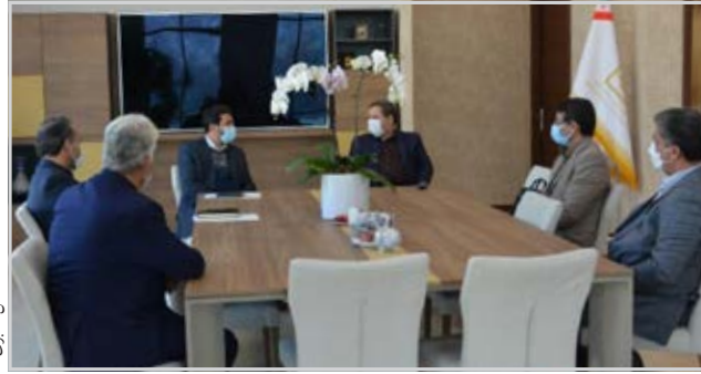
نظر موقف عمل کنند، در جلسه آتی برای این

استان تدوین شده، تصریح کرد: طبق این سند ما از حضور سرمایه گذاران استقبال می‌کنیم و شرایط را برای فعالیت آنها تسهیل می‌نماییم. ملائوری با اشاره به استعدادهای معدنی و صنعتی استان به مدیرعامل بانک صنعت و معدن، مشارکت و سرمایه گذاری در واحدهای مرتبط را خواستار شد. وی تأکید کرد: ایجاد و توسعه صنایع فراآوری جوار معدنی در راستای بهره‌وری بیشتر از ذخایر، از برنامه‌های استان است.