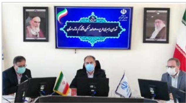
نظر موقف عمل کنند، در جلسه آتی برای این

۶ شهرستان هنوز نتوانسته در این طرح موفقیتی داشته باشد