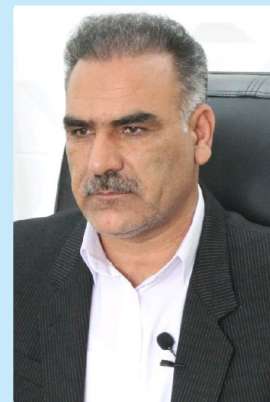
پيام شهردار بیرجند به مناسبت ولادت حضرت زینب (س) و روز پرستار

شهردار بیرجند در پیامی میلاد باسعادت حضرت زینب سلام... علیها و روز پرستار را به تمامی پرستاران که از زمان شیوع ویروس منحوس و مهاجم کرونا بدون هیچ چشم داشتی برای تامین، حفظ و ارتقای سلامت مردم تلاش کردند، تبریک و از زحمات شان تشکر و قدردانی کرد.