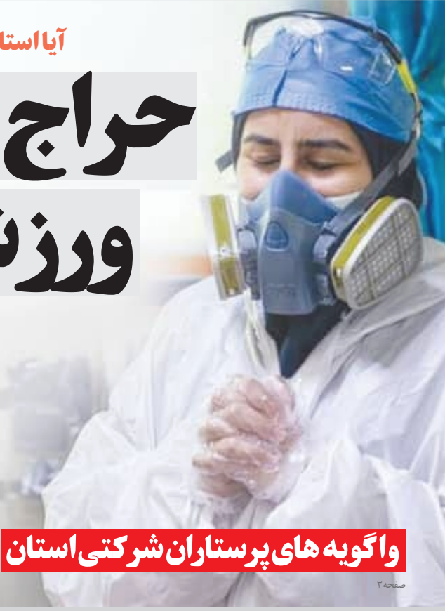
واگویی های پرستاران شرکتی استان

اداره کل ورزش و جوانان استان برخی از ساختمان ها و وسایل نقلیه خود را به مزایده گذاشت. ۳ آذر ماه که اولین نوبت آگهی مزایده ساختمانی در رسانه ها منتشر شد با واکنش جمعی از اهالی ورزش مواجه گردید. آنها معتقد بودند در حالی که بسیاری از هیئت های ورزشی محلی برای ایجاد دفتر ندارند ... مشروح در صفحه ۳