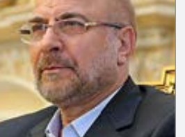
رئیس مجلس شورای اسلامی با بیان اینکه وظیفه مجلس است که دولت را وادار به کار کند، گفت: دولت را وادار به کار کند، اما اول به سازماندهی مجلس پرداختیم و از شهریورماه سال جاری توانستیم دولت را به فراخور موضوعات مختلف وادار به کار کنیم.