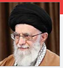
رئیس جمهور گفت: آن روز که ما برای برجام مذاکره می‌کردیم، ۶ شمشیر بالا سر ما بود به اسم قطعنامه، یک شمشیر بالاسرمان بود به نام پی‌ام‌دی؛ این شمشیرها شکستند. روحانی با بیان اینکه اگر فشاری هست از جانب استکیباری است که به هیچ چیز پایبند نبود، گفت: باقی‌ترین و قانون‌شکن‌ترین فرد در