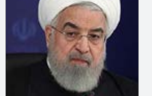
رئیس جمهور گفت: آن روز که ما برای برجام مذاکره می‌کردیم، ۶ شمشیر بالا سر ما بود به اسم قطعنامه، یک شمشیر بالاسرمان بود به نام پی‌ام‌دی؛ این شمشیرها شکستند. روحانی با بیان اینکه اگر فشاری هست از جانب استکیباری است که به هیچ چیز پایبند نبود، گفت: باقی‌ترین و قانون‌شکن‌ترین فرد در

به هیچ چیز متعهد نبود، سرنگون شده است، اظهار کرد: راه برای دولت بعدی آمریکا باز است؛ اگر دولت آمریکا مسیر درست خواست، آماده است و اگر مسیر اشتباه خواست: آماده است. امیدواریم رای مردم آمریکا برای حکومت جدید آمریکا روشن باشد که این رای به قانون‌گرایی است و نه قانون‌شکنی وی