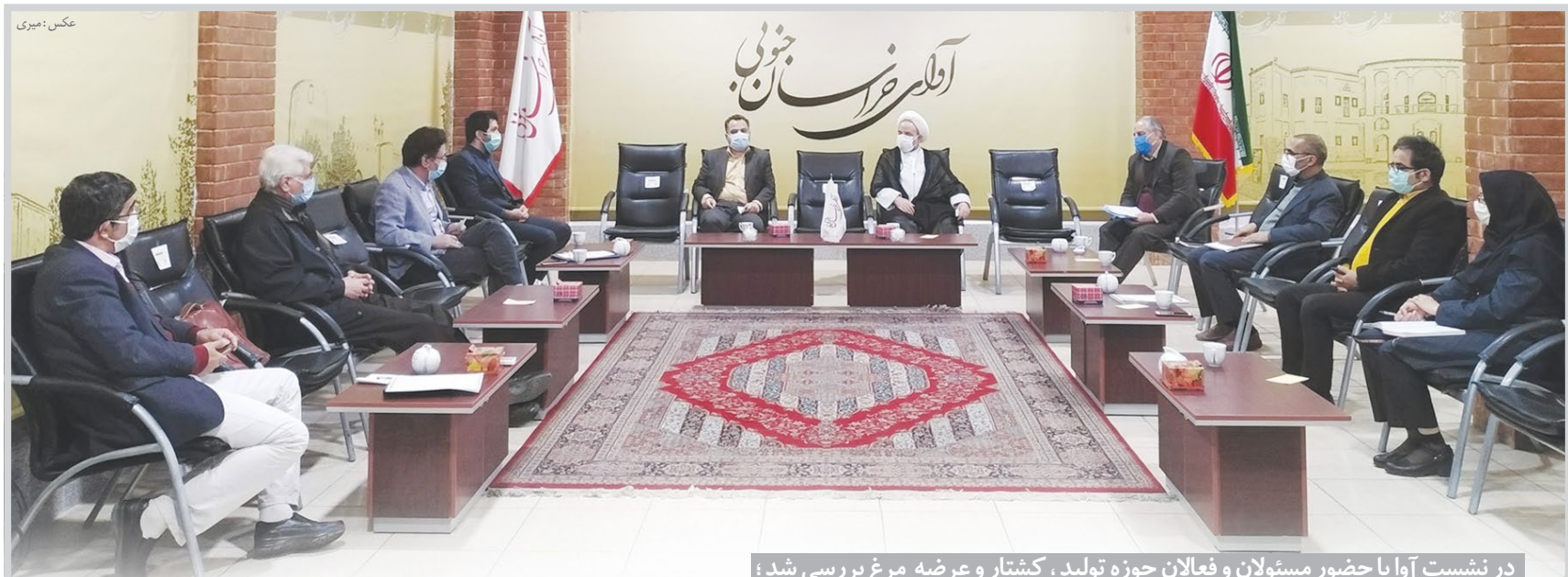
در نشست آرا با حضور مسئولان و فعالان حوزه تولید، کشتار و عرضه مرغ بررسی شد.

روزنامه صبح استان * سال بیست و چهارم * شماره ۴۷۹۵