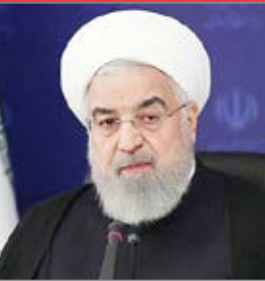
رئیس جمهور با بیان اینکه در طول هفته های گذشته تصمیمات مهمی را برای ۹ ماهه پایانی دولت گرفته ایم،

گفته: هماهنگی های لازم بین بانک مرکزی، وزارت صمت، کشاورزی و اقتصاد صورت گرفته است و مصوبه اش ابلاغ شده است. روحانی با بیان اینکه برای ما مهم نیست در آمریکا چه کسی انتخاب می شود، گفت: انتخابات اخیر آمریکا از جهات مختلف عبرت آمیز بود که فعلا نمی خواهیم به آن وارد شویم. برای ما حزب و فرد مهم نیست، شیوهی