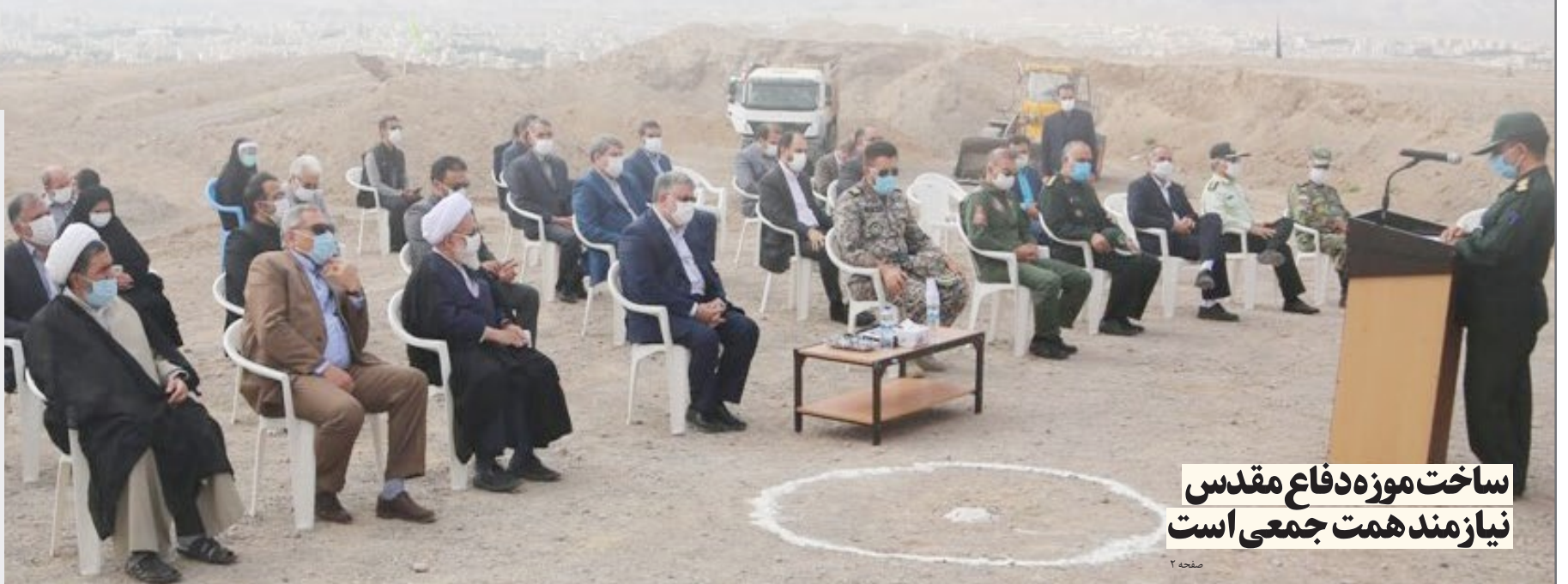
ساخت موزه دفاع مقدس نیازمند همت جمعی است

استاندار، نامطلوب بودن فضای سبز شهری، عدم تنوع در نورپردازی و المان های شهری را از جمله مشکلات موجود در فضای شهری شهرها برشمرد و گفت: برای بهبود شرایط موجود باید از تجربه دیگر مناطق به ویژه استان های هم اقلیم استفاده کرد. معتمدیان با اشاره به این که کاربرد گونه های متنوع گیاهی، تغییر اساسی در فضای سبز ایجاد می کند، تأکید کرد: مردم نیاز به تنوع دارند و زیباسازی شهر می تواند تأثیر مطلوبی بر روحیه مردم داشته باشد. وی ادامه داد: شهرداری ها می توانند برای جبران کاستی های موجود از توان و ظرفیت سازمان همیاری شهرداری های استان استفاده کنند ... مشروح در صفحه ۲