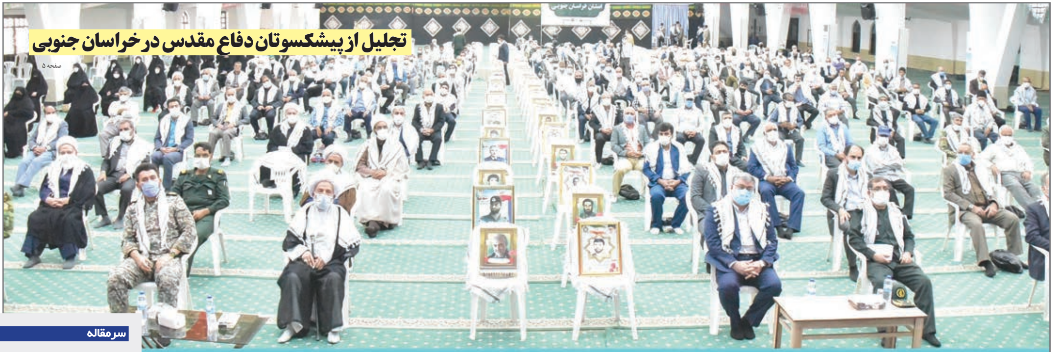
تجلیل از پیشکسوتان دفاع مقدس در خراسان جنوبی

روزنامه صبح استان * سال بیست و چهارم * شماره ۴۷۲۵