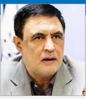
یا مردم در آسایش خواهند بود. اینها افزایش انتظارات بود.

انتظارات مردم در فضای انتخابات اظهار کرد: شاید بتوان گفت یکی از بزرگترین اشتباهات دولت آقای روحانی این بود که در دولت اول خود مسئله افزایش تقاضای عمومی یعنی حقوق جزای عمومی را از دولت و حاکمیت به شدت بالا برد. وی بیان کرد: علت ریشه ای بخشی یا شاید بتوان گفت بخش قابل توجهی از