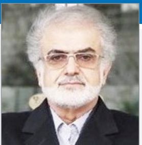
نشان داد که جواب نمی دهد.

فعال سیاسی اصلاح طلب با بیان اینکه دولت روحانی در چهار سال نخست انتظارات را برآورده کرد، یادآور شد: دولت روحانی اما در دور دوم شد همان دولت احمدی نژاد؛ چون آقای روحانی در دوره دوم ریاست جمهوری وضعیت کشور را