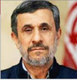
محمود احمدی نژاد تأکید کرد که از سخنان و عملکردش در دو دوره

ریاست جمهوری پیشیمان نیست، او در واکنش به گزارش ها درباره تلاش او برای ملاقات با رهبری برای شرکت در انتخابات هم گفت: متأسفانه رسانه ها نظرات خودشان را منتشر می کنند بدون این که دنبال سند باشند. وی در گفت و گویی اختصاصی مقابل دوربین رادیو اروپای آزاد / رادیو آزادی نشست و