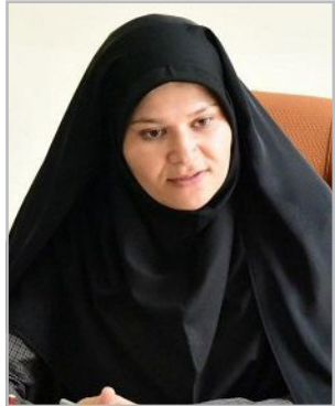
مدیرکل دفتر امور روستایی و شوراهای استانداری خراسان جنوبی

ایرنا– مدیرکل دفتر امور روستایی و شوراهای استانداری گفت: ۲ هزار و ۶۳۵ میلیارد ریال اعتبار از سال ۹۲ تاکنون به دهیاری‌های استان اختصاص یافته که نسبت به دوره قبل رشد ۵۷۹ درصدی داشته است. علیه خواجوی روز گذشته در گفت و گو با خبرنگار ایرنا افزود: این اعتبارات از محل منابع مختلف بوده که در زمینه توسعه زیرساخت‌های روستاهای استان