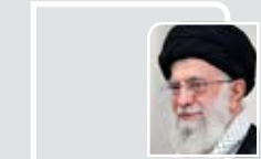
رهبر معظم انقلاب:

گشایش نخستین همایش مجازی در دانشگاه بیرجند با موضوع آب