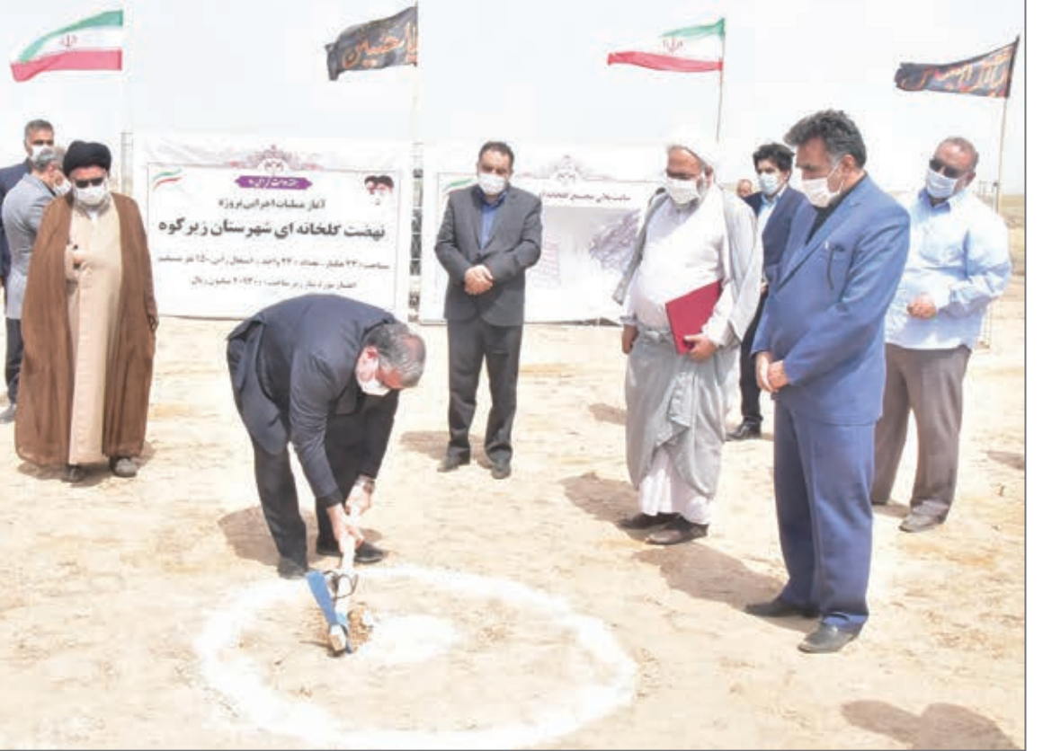
۱. نهدت گلخانه‌ای به زیر کوه رسید ۲. رئیس مجمع نمایندگان: خدمات معتمدیان در توسعه استان بی نظیر است ۳. تالاب کچی نمکزار؛ پناهگاه حیات وحش ۴. ۵

استاندار گفت: براساس چهار شاخص وضع موجود را احصا و طرح و برنامه‌هایی را تدوین کرده‌ایم که در قالب سند توسعه استان به میانگین کشوری که خروج از محرومیت است، نایل شویم. معتمدیان در آیین آغاز عملیات اجرایی ۶ هزار واحد مسکن شهری برای اقشار کم‌درآمد که همزمان با سومین روز هفته دولت در زیرکوه برگزار شد، افزود: چون برنامه جهشی است بنا داریم از ظرفیت حداکثری دولت، دستگاه‌های حاکمیتی و نهادهای انقلابی استفاده کنیم. وی اظهار کرد: وی اظهار کرد: برای محرومیت‌زدایی زیرکوه با قرارگاه محرومیت‌زدایی سپاه تفاهم‌نامه منعقد شده تا با کمک این نهاد انقلابی بتوانیم محرومیت را از این منطقه برداریم. استاندار گفت: با تلاشی که نمایندگان پرتلاش استان دارند، امیدواریم بتوانیم روزهای خوبی برای استان داشته باشیم و از شرایط سخت عبور کنیم و در این شرایط سخت اقتصادی که ناشی از ظلم دشمنان نظام است، آینده خوبی برای استان و این شهرستان مرزی داشته باشیم ... ادامه در صفحه ۳