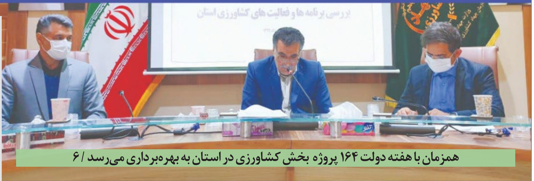
همزمان با هفته دولت ۱۶۴ پروژه بخش کشاورزی در استان به بهره برداری می رسد / ۶

معاون وزیر اقتصاد: سهام عدالت خراسان جنوبی پذیره نویسی بورس شده و به نسبت دیگر استانها پیشرو است / مدیر کل اقتصادی و داری استان: ۷۱ درصد مشمولان در استان روش غیر مستقیم را انتخاب کرده اند استاندار خراسان جنوبی گفت: ارزش سهام عدالت و داری استان ۹ هزار میلیارد تومان است که این مبلغ در حال توسعه ما می تواند با سرمایه گذاری در طرح های مختلفه درآمیزی خوبی برای مردم به همراه داشته باشد. محمدصادق معتمدیان در نشست آزادسازی سهام عدالت شرکت سرمایه گذاری استان و نهاد بورسی آن که با حضور معاون توسعه مدیریت و منابع وزیر امور اقتصادی و دارایی در بیرجند برگزار شد، افزود: مردم استان از سود و انتفاع شرکت سرمایه گذاری سهام عدالت برخوردار خواهند شد و می توانند زمینه های تجارت بین الملل، فناوری محصولات کشاورزی، گردشگری و معادن در استان ریل گذاری شده است که اثرات مطلوبی را برای مردم به دنبال خواهد داشت. استاندار خراسان جنوبی گفت: یکی از مباحث بسیار مهمی که به فرمان مقام معظم رهبری و با تدبیر دولت در سال ۹۹ اجرائی شد، موضوع آزادسازی سهام عدالت بود که ... مشروح در صفحه ۳