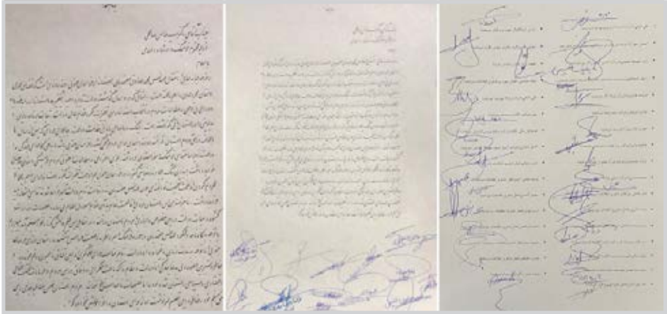
طومارهای مردم خراسان جنوبی برای ماندن استاندار به مقامات کشور

جایی فردی که پس از سال‌ها اجحاف در حق مردم استان، توانسته روزنه امیدی برای مردم سختی کشیده خراسان جنوبی باشد جز طومار های امضا شده متعددی به مسئولان کشوری از رئیس جمهور گرفته تا وزرای کابینه دولت، رسید. تلوم‌سکانداری معتمدیان برای ادامه ریل گذاری ها در استان به سمت توسعه و درخواست توجه دولت و مقامات به این مطالبه خراسان جنوبی با توجه به اهمیت استراتژیک این استان در سطح ملی، از دلایل مردم، شخصیت ها و گروه های خراسان جنوبی برای تکرار پیایی این مطالبه، نامه با امضاء ده‌ها تن از مردم استان برای رئیس جمهور ارسال شده. جملات این نامه خواسته ای روشن از رئیس دولت دارد: «جناب آقای دکتر حسن روحانی، ریاست محترم جمهوری با سلام؛ زمزمه جابه جایی و انتقال مهندس محمد صادق معتمدیان استاندار خراسان جنوبی، چند روزی است که فضای عمومی استان محرومان را بهم ریخته است. استانی که در ۷ سال گذشته دولت حضرت تعالی تغییر جهت تغییرات مکرر استانداران و هم به لحاظ محروم کردن از نعمت شخصیت توانمندی چون مهندس معتمدیان نه در قامت تدبیر دولت تفسیر خواهد شد. نه تناسبی با شمار امید خواهد داشت. ما شهروندان این استان مرزی