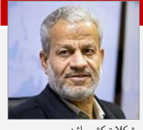
مشکلات کشور باشد.

به شدت متقی فرسخنگوی جبهه پایداری گفت: اصلاح طلبان برای انتخابات ۱۴۰۰ قدرت تصمیم گیری و با معرفی کاندیدا را ندارند و با دست کم این گونه به نظر می رسد. اصلاحات الان ظرفیت اجتماعی خود را کاملاً از دست داده و