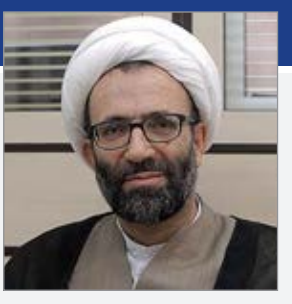
عضو هیئت رئیسه مجلس شورای اسلامی خطاب به رئیس جمهور گفت: لطفاً علیه گران فروشی که اتفاقاً

دولتی شنیدنی بود. آقای روحانی رئیس دولت هستند و اگر اراده و عزم جدی برای مقابله با گران فروشی دارد، اقدام کند. وی ادامه داد: آقای رئیس جمهور به نوعی سخن می گوید که تصور می شود قرار است رئیس جمهور شود، آقای روحانی باید علیه گران فروشی که اتفاقاً بخشی از دولت است اقدام کند. مگر کسی مانع است؟ عضو هیئت رئیسه مجلس شورای اسلامی خطاب به رئیس جمهور گفت: لطفاً علیه گران فروشی که اتفاقاً بخشی از آن در دولت است اقدام کنید. حجت الاسلام علیرضا سلیمی با اشاره به اظهارات اخیر حجت الاسلام حسن روحانی رئیس جمهور مبنی بر اینکه شرکت های دولتی حق ندارند به بهانه های مختلف قیمت جنس را اضافه کنند و آن را گران تر بفروشند، گفت: گلابه اخیر آقای روحانی درباره گران فروشی کالا توسط شرکت های